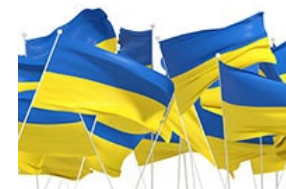
Регіональна підтримка для українських новачків