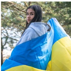
Регіональна підтримка для українських новачків